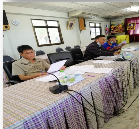
ภาพประกอบการประชุมของคณะกรรมการติดตามและประเมินผลแผนพัฒนาท้องถิ่น